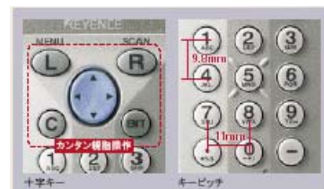
親指ひとつで簡単操作